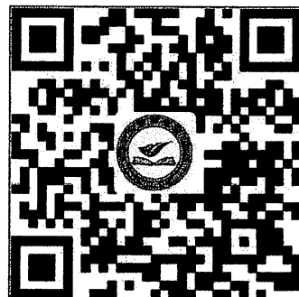
2021年全省初级中学 信息技术骨干教师考前培训 课程报名二维码